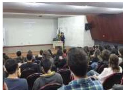
Figura 3: Eventos coordenados e organizados pelo projeto.