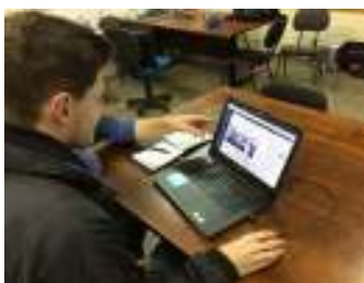
Figura 03 - Troca de conhecimento entre docente e discente.