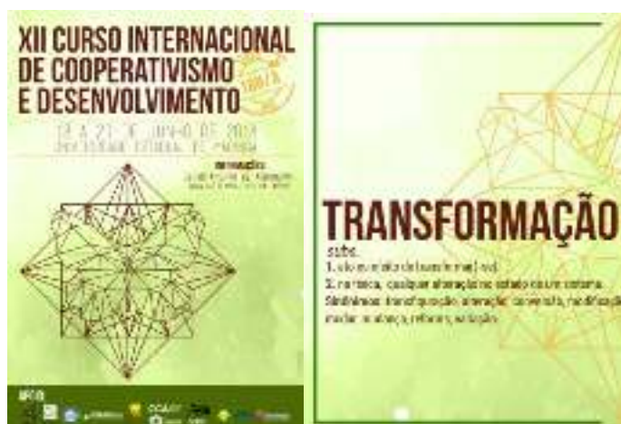
Figuras 3 e 4. Cartaz em A3 para a divulgação do evento e Post para mídias sociais.

Ao pensar no conceito dessas peças, trouxe o símbolo máximo de transformação na natureza, a borboleta, interna a uma mandala geométrica, a qual remete a todo esforço físico e intelectual necessários para se realizar alguma mudança. Atualmente, me sinto muito mais realizada ao pensar e criar conceitos a cuidar de mídias sociais e sei que este crescimento só foi possível devido à confiança depositada pela equipe em meus trabalhos. Hoje, me despeço do projeto já com contrato junto a uma agência de design e reconheço que só fui notada por ter sido incentivada a crescer dentro do CerAUP ao poder usar minhas horas para fazer cursos online e, dessa forma, agregar mais conhecimento para mim e para o projeto.