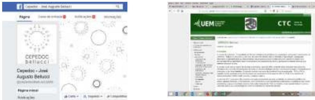
Figura 1. Páginas do Face book e do site do projeto CEPEDOC.

sistematizados, após, são publicados na mídia social Facebook , em página específica do projeto, e, através desse canal, é feito o convite à toda comunidade para conhecer, manipular e consultar o acervo nas instalações físicas do laboratório, ou mesmo através da página. Posteriormente o conteúdo é publicado no sítio do projeto com todas as suas informações básicas, juntamente com algumas imagens e disponível para download . A classificação desse material é dividida em TCC's, cadernos de resumo, resumos de pesquisas, anais de eventos, coleções e revistas. Quando se trata especificamente dos Trabalhos de Conclusão de Curso, o projeto disponibiliza a versão digital, tanto dos conteúdos textuais das monografias, quanto das pranchas de desenhos, contendo os registros gráficos bidimensionais e tridimensionais, para que o alcance na disseminação da informação seja potencializado e possa atingir o público virtualmente, vinculados ou não à universidade.