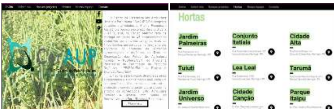
Figuras 1 e 2. Prints da tela do site do projeto.

Lembro-me do professor perguntando o que eu estava fazendo ali e se eu gostava de trabalhar nessa área, com toda a sinceridade do mundo respondi que não sabia muito, mas estava disposta a aprender e disse que eu sabia que não iria trabalhar fazendo campanhas apenas de marcas de chocolate ou coisas que gosto, então teria que aprender a gostar de agricultura urbana e me aprofundar mais nesse meio. Em meados de junho encontrei o professor na cantina central, ele me disse que eu havia sido aprovada e que só estava esperando sair o edital. Assim, em Agosto de 2017 ingressei como bolsista pela Fundação Araucária no projeto REDifeira. A primeira e principal dificuldade que tive foi compreender o que era este projeto o qual estava entrando. O REDifeira está interno a um projeto maior, o CerAUP – Centro de Referência em Agricultura Urbana e Periurbana – e alocado junto ao Programa Paraná Mais Orgânico e ao Projeto de Extensão Rural. E, assim que tive parte das minhas dúvidas sanadas, comecei os meus trabalhos com um site que era o principal pedido tanto do professor, quanto dos bolsistas mais experientes.