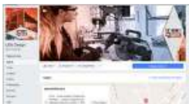
Figura 02 - Página Design UEM no Facebook

Em sua fase inicial, quando se estava criando o site, poucos alunos se interessaram em colaborar com a criação de conteúdo. Entretanto, atualmente, a busca aumentou, sendo que no ano de 2018 houveram oito interessados para a vaga de discente, número superior aos demais anos, onde, em média, havia três candidatas. Com o aumento no interesse pelo projeto, o retorno dos alunos que buscam por informações sobre o curso também aumentou. Aqueles que já apresentavam um conhecimento prévio do conteúdo do site, que é uma fonte de suma importância para os vestibulandos, além de buscar informações no site, encontram a página do curso no Facebook (Figura 02), o que possibilita uma troca direta de informações com docentes e discentes. Diante desta crescente procura pelas mídias digitais sobre o curso, o layout está em processo de alteração, visando facilitar a interface e efetivar uma identidade visual para o curso.