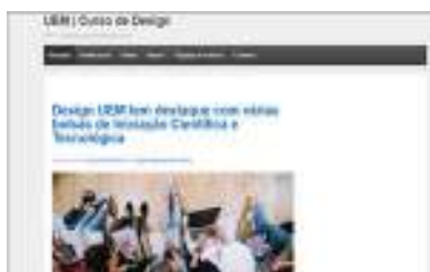
Figura 01 - Site DDM - UEM Design Atual

Criado inicialmente para informar e divulgar à comunidade interna sobre as atividades da graduação, o site do Curso de Design da UEM (Figura 01) conseguiu conquistar um público cativo, que busca saber o que está acontecendo no curso. Desta forma, tornou-se uma conexão do curso com os alunos e vice-versa, sendo uma fonte de compartilhamento que tem, além do que já foi citado, um outro diferencial: a vinculação com os demais projetos do Campus de Cianorte. Pois, a partir de postagens do site e da rede social do curso, consegue-se atingir um público maior, desde alunos recém formados do Design e de outros cursos, a empresas interessadas em parcerias com o curso ou na contratação de alunos, como estagiários ou funcionários.