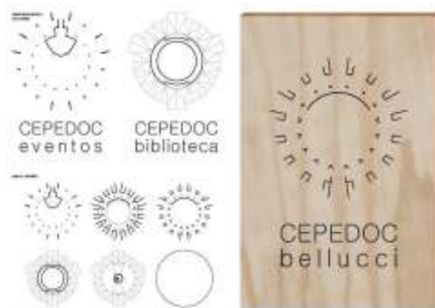
Figura 2: Nova logo do CEPEDOC, de autoria de Vinícius Alves de Araújo.