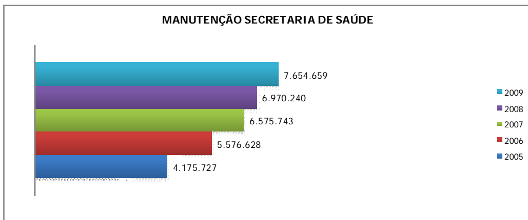
Quadro 1- Recursos aplicados na ação Manutenção da Secretaria de Saúde (valores originais)