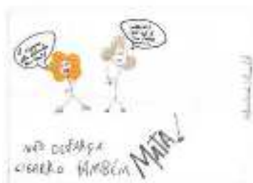
Figura 6: 2º Lugar na categoria II