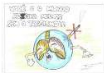
Figura 4: 1º Lugar na categoria II