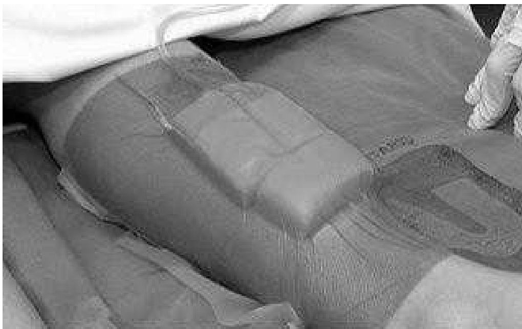
Figura 2. Curativo a vácuo.