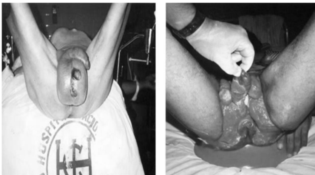
Figura 1. Imagem à esquerda: sacro escrotal edemaciado com ponto necrótico. Imagem à direita: região perineal e genital com tecido de granulação.

Nessa perspectiva pode-se observar que o desbridamento do tecido necrótico e os curativos foram essenciais para uma boa evolução do tecido de granulação por todo o leito da ferida. Além disso, o tratamento com o AGE nessa fase da lesão foi muito importante para mantê-la nutrida e auxiliar na formação do tecido de cicatrização, concomitantemente com a higienização diária para a não proliferação microbiana, evitando a reincidência da síndrome.