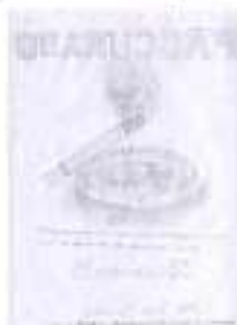
Figura 3: 3º Lugar na categoria I