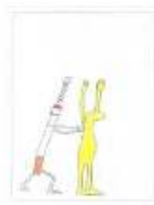
Figura 7: 3º Lugar na categoria II

A divulgação do resultado do concurso foi feita n o site do Projeto´-Tabagismo http://sites.uem.br/tabagismo e a premiação foi realizada durante a XIV Maratona de Revezamento Vanderlei Cordeiro de Lima - Pare de Fumar Correndo, assim como a