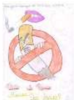
Figura 1: 1º Lugar na categoria I

alunos que criassem desenhos com o tema Tabaco e Meio Ambiente. Estes trabalhos foram avaliados quanto aos critérios de criatividade e harmonia com a temática: tabagismo e sua repercussão na saúde e no meio ambiente. Ao final do concurso, foram então classificados e premiados 7 desenhos, 3 da categoria I e 4 da categoria II. Conforme demonstram as Figuras : 1,2,3,4,5,6 e 7.