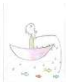
Figura 5: 2º Lugar na categoria II