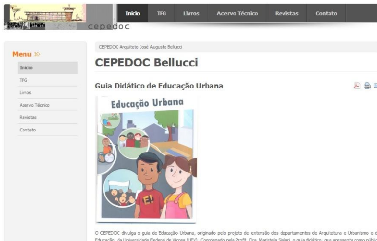
Figura 1 – Interface do novo site do CEPEDOC.

acordo com a lista atualizada presente no local. Depois de pesquisar em casa o usuário encontra com mais facilidade o material no acervo físico do laboratório. Cada TFG publicado no site recebe uma página própria onde constam informações como autor(a), orientador(a), ano de conclusão, resumo do trabalho e três imagens do projeto final realizado.