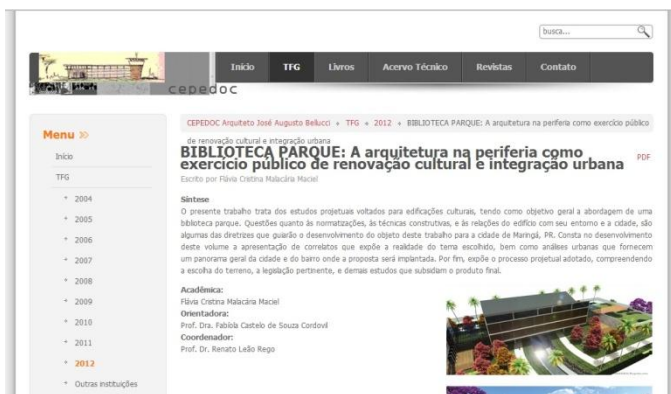
Figura 3 – Página própria de um dos TFG no site do CEPEDOC.